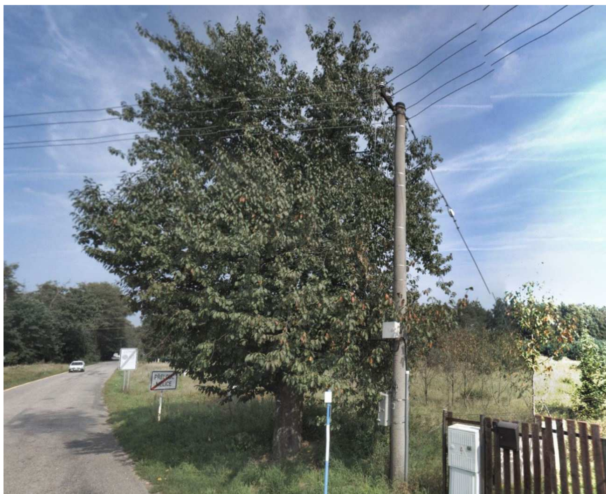
Fotografie č.1.: strom S1 - Třešeň